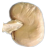
Rim de ovino KONIGet al. (2016)